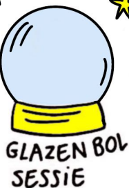
GLAZEN BOL SESSIE